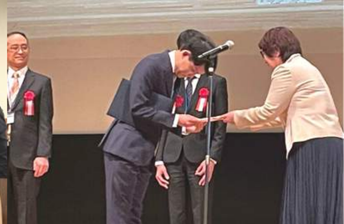
▲日本造血・免疫細胞療法学会 寄付贈呈式(東京国際フォーラムにて)