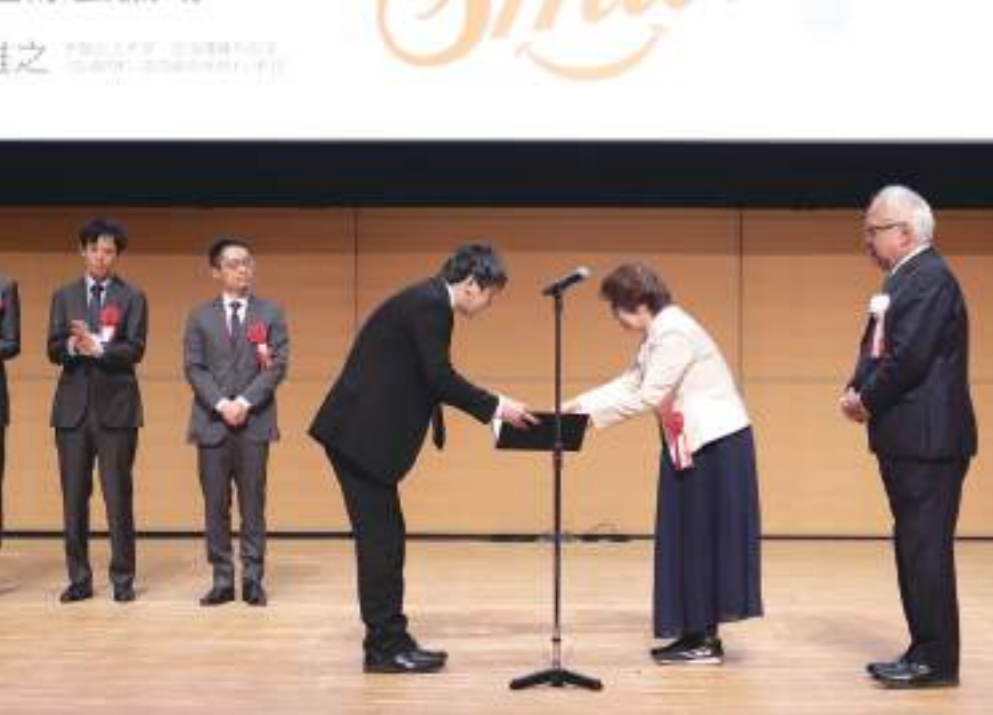
▲ 一般社団法人 日本造血・免疫細胞療法学会 表彰式