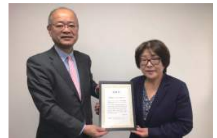
▲ 認定特定非営利活動法人 ピースウィンズ・ジャパンより感謝状受領(2024年度)